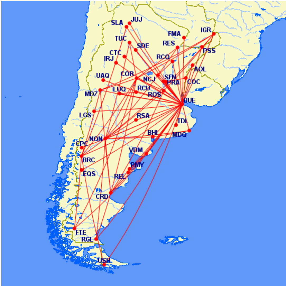
Mapa 1: Resultados de las rutas de cabotaje aprobadas sin restricciones por par de ciudades.